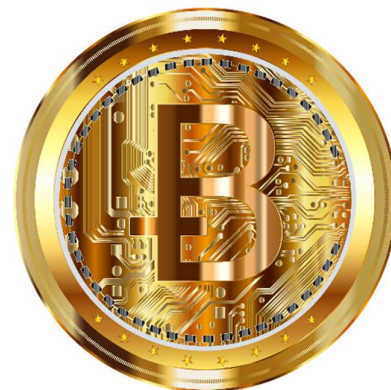
Abbildung 1: Anwendungen, die auf Blockchain-Technologie basieren am Beispiel von Bitcoin

Email: melanie.heck@ipvs.uni-stuttgart.de , frank.duerr@ipvs.uni-stuttgart.de